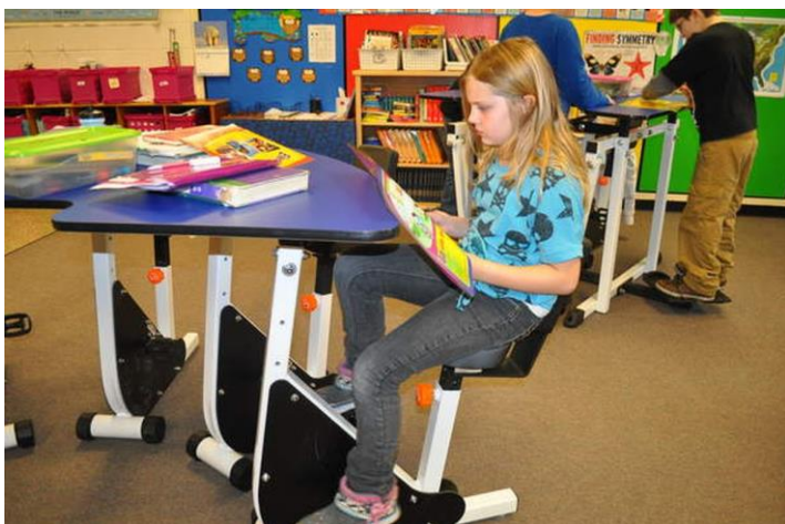
Slika 1: Možnost uporabe kinestetične mize pri pouku.

https://www.google.com/search?q=razred&client=firefox-b&source=lnms&tbm=isch&sa=X&ved=0ahUKEWjSpbjGs9PdAhXCiWkHeekDtIQ_AUICigB&biw=1536&bih=728#imgrc=tfHs5jf60Q2-4M